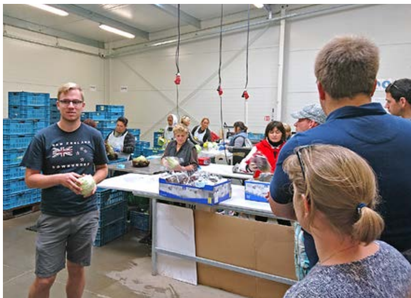
We bezochten onder andere 'Farma Ráječek', een tuinbouwbedrijf in Brno.

☞ België geteeld wordt. Skoda vond ik een unieke kans. En tot slot de rondleiding in Praag, dit is een mooiere stad dan ik verwacht had.”