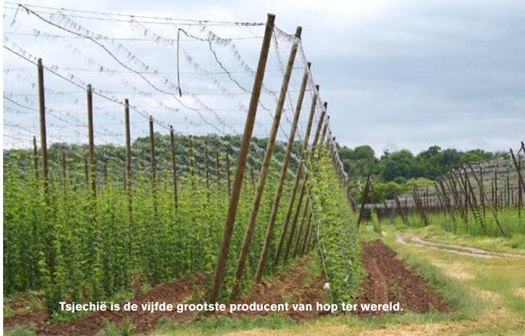
Tsjechië is de vijfde grootste producent van hop ter wereld.

Pravice, een klein dorpje in Zuid-Moravië. We hebben 10 hectaren hoogstamfruitbomen met verschillende vruchten: appels, peren, perziken, kersen, amandelen ... Verder hebben we ook nog 35 hectaren wijngaard, akkerland en bos. We boeren in de droogste en warmste regio van Tsjechië. Zelf heb ik geen landbouwachtergrond, ik studeerde politiek, theologie en rechten.”