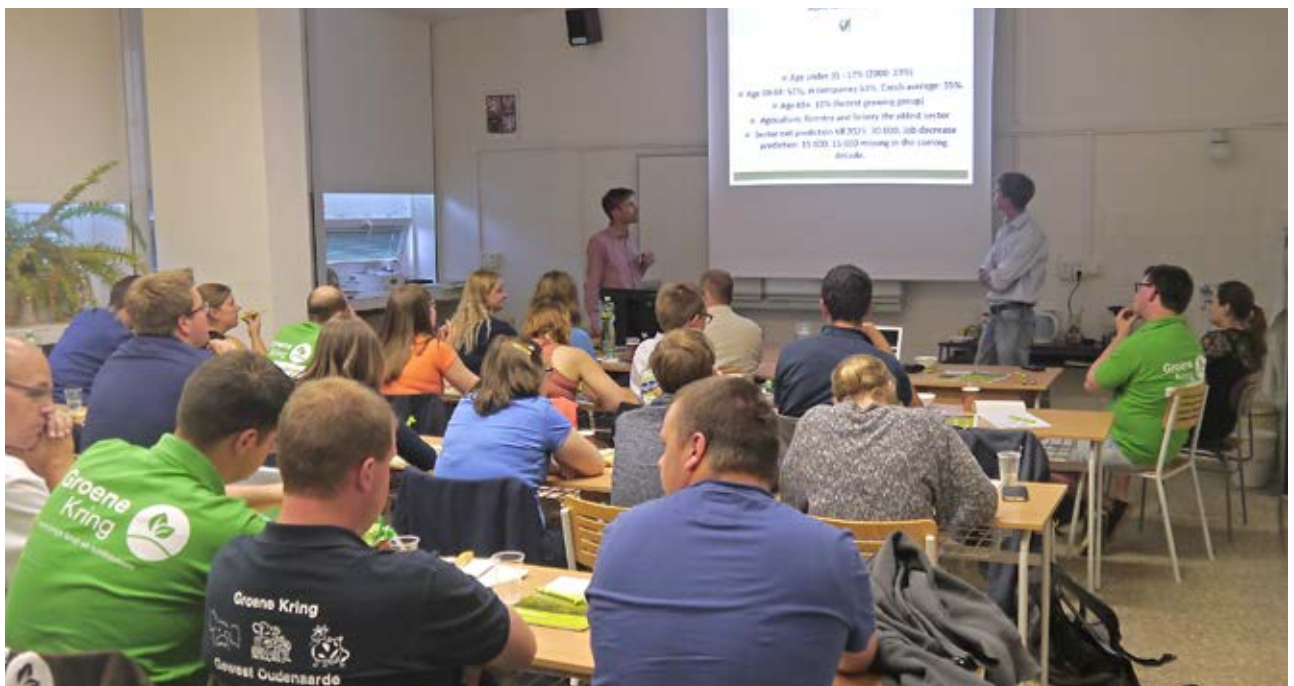
Tijdens de verbodering tussen SMACR en Groene Kring kregen we uitleg over de landbouw in Tsjechië en de werking van hun jongerenorganisatie.